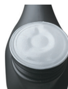
Уплотнитель с индукционной запайкой