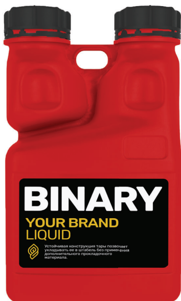
КАНИСТРА 5 Л