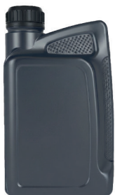
КАНИСТРА ДЛЯ МОТОРНОГО МАСЛА 1 л