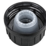
Крышка Берикап с системой вентиляции (Bericap SVB) 50/23 ПА (PA)