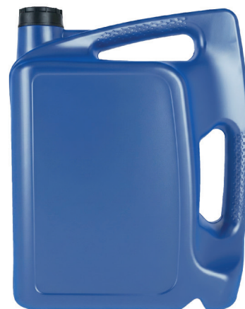
КАНИСТРА ДЛЯ МОТОРНОГО МАСЛА 9,5 л