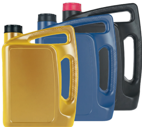
КАНИСТРА ДЛЯ МОТОРНОГО МАСЛА 4 л / 4,7 л / 5 л