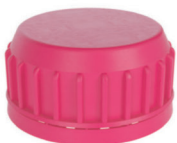
Крышка СК 40