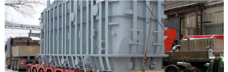
ПЕРЕВОЗКА ТЯЖЕЛОВЕСНЫХ ГРУЗОВ