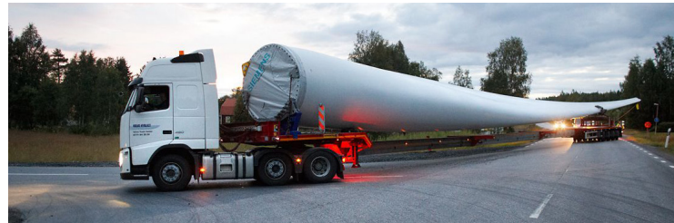
ПЕРЕВОЗКА ДЛИННОМЕРНЫХ ГРУЗОВ