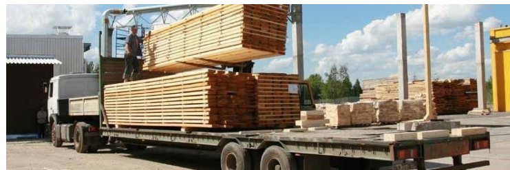
ПЕРЕВОЗКА СТРОИТЕЛЬНЫХ ГРУЗОВ