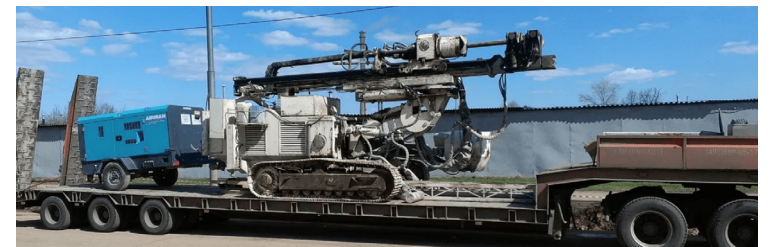
ПЕРЕВОЗКА БУРОВОЙ УСТАНОВКИ