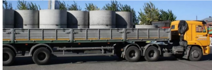
ПЕРЕВОЗКА БЕТОННЫХ КОНСТРУКЦИЙ