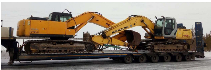
ПЕРЕВОЗКА ГУСЕНИЧНОЙ ТЕХНИКИ