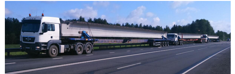
ПЕРЕВОЗКА МОСТОВЫХ БАЛОК