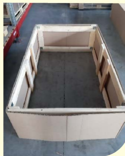
Часть модуля (внутренняя муфта), дополнительно усиленная фумигированной древесиной. Весь каркас складывается в компактный размер и размещается в транспортном коробе, смонтированном на поддон. Модуль выдерживает давление свыше 4500кг.