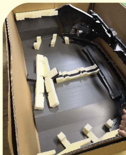
Тара для упаковки автомобильного бампера с использованием сотового полипропилена и изолона. Эти материалы хорошо зарекомендовали себя при упаковке крашенных деталей.