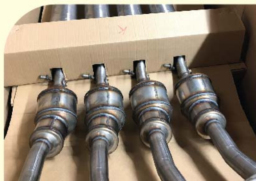
Упакованные системы автомобильных глушителей в крупногабаритный модуль 2200x1040x750мм.

При разработке тары мы используем такие программы как: Autocad, Impact, Heidelberg, что с легкостью позволяет нам работать в 3D формате. FoxBox берет на себя полный цикл проектирования, начиная с выезда специалистов на площадку потребителя и заканчивая сопровождением тестовой партии и совместной упаковки готовой продукции для проведения транспортного теста и достижения положительного результата.