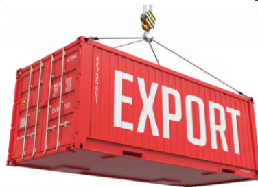
Экспорт из России в Китай