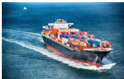
Контейнерные перевозки по морю из Китая, ЮВА, Турции