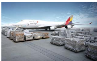
Авиаперевозки в Россию