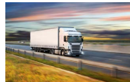
Автоперевозки из Китая, Турции и Европы