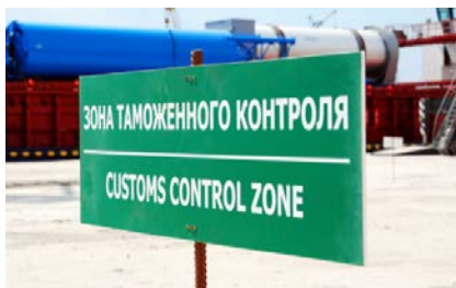
Таможенное оформление на контракт клиента