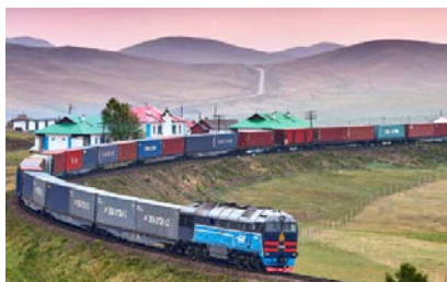
Контейнерные перевозки по ЖД из Китая