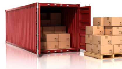
Доставка сборного груза по ЖД из Китая