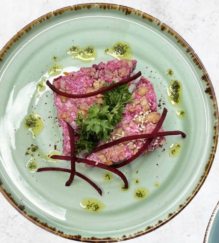
Салат слоеный со свеклой