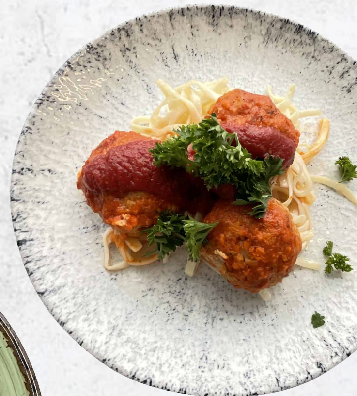
Спагетти с фишболами в томатном соусе