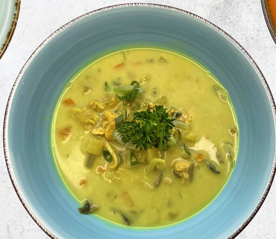
Суп с лососем, морепродуктами и грибами на кокосовом молоке