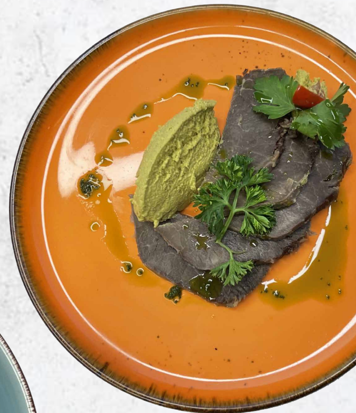
Говядина в соусе Цахтон