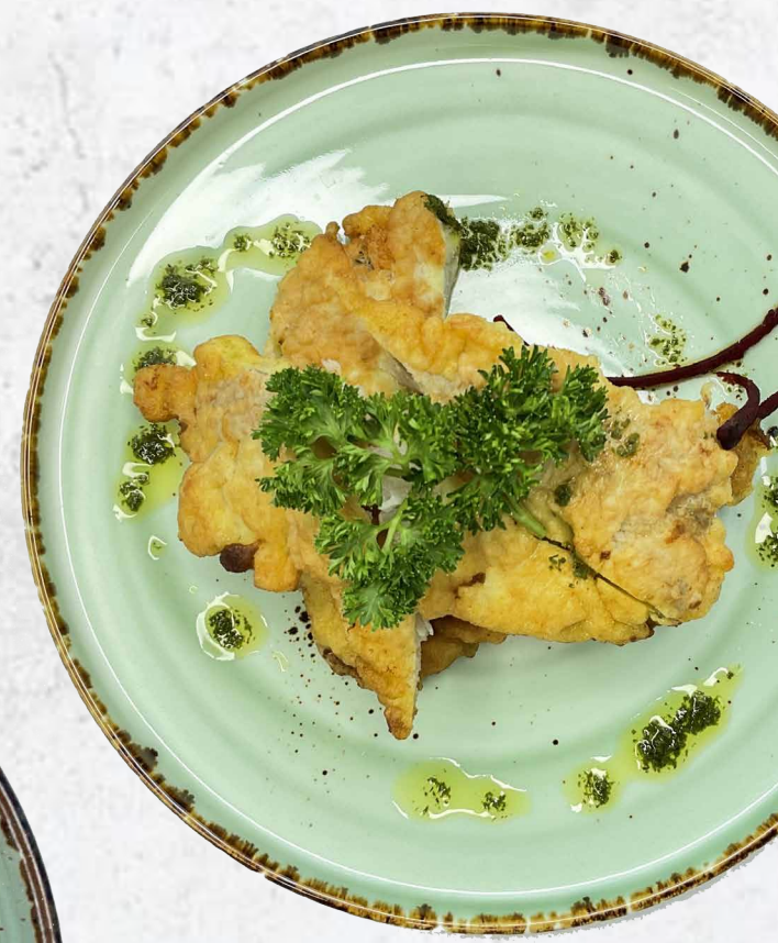
Хек в кляре с соусом тар-тар