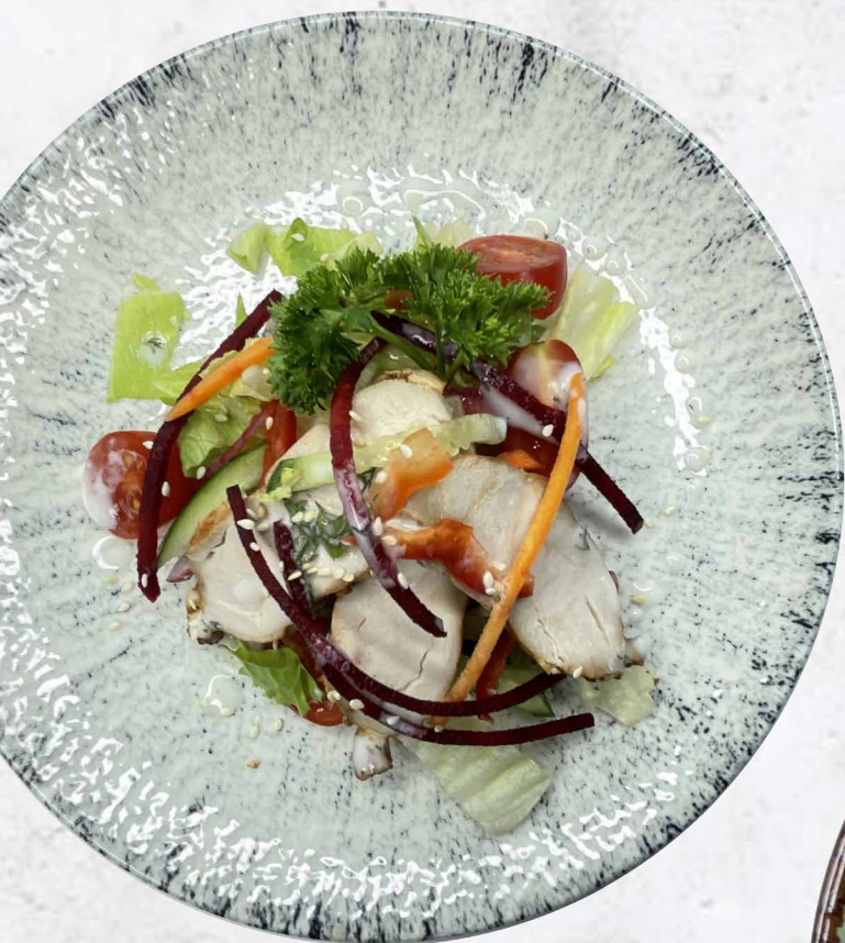
Салат с куриным филе и апельсинами с греческим соусом