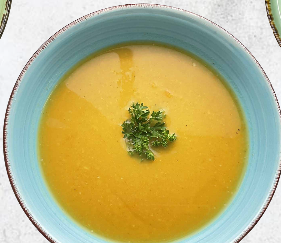
Суп-пюре тыквенный с горохом постный