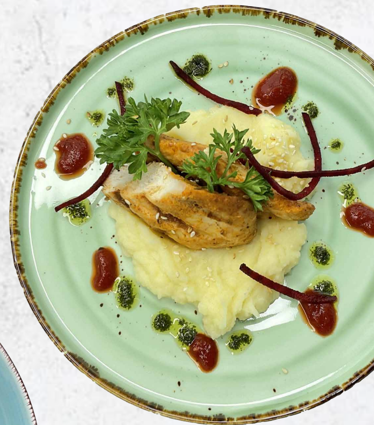
Куриная грудка-гриль премиум с соусом песто и картофельным пюре