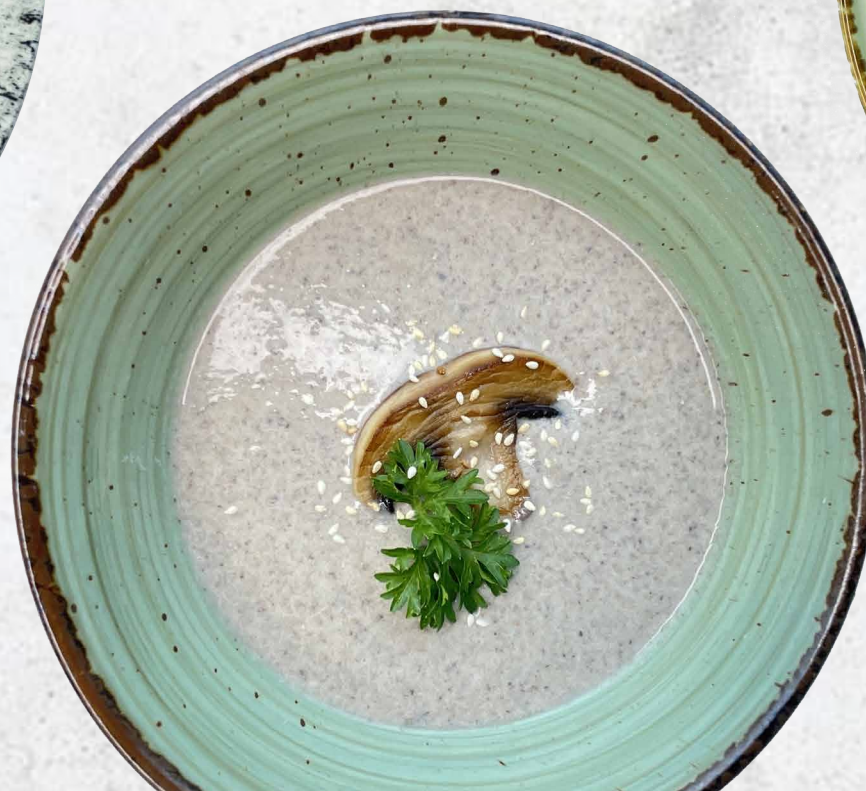
Суп-пюре из шампиньонов со сливками