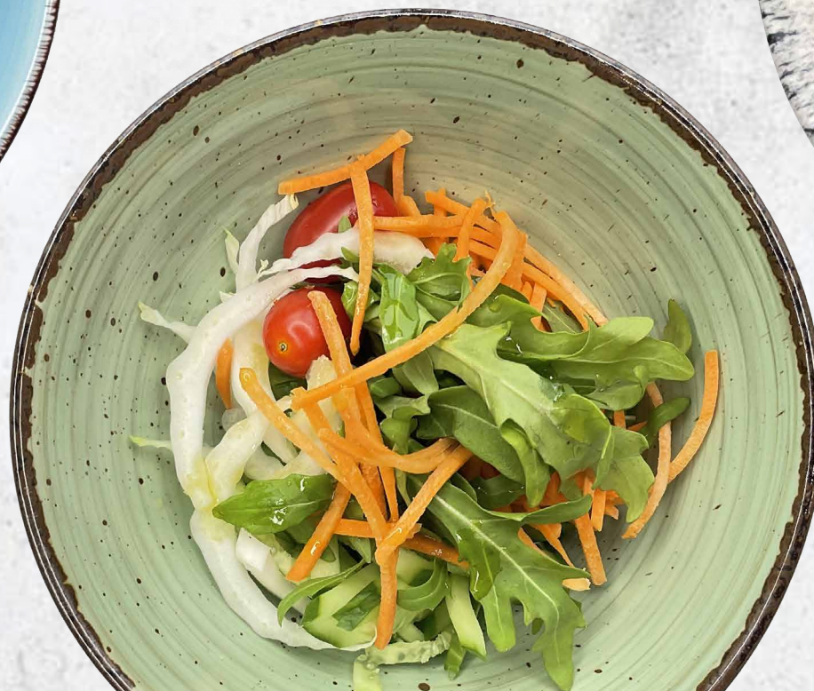
Микс-салат с помидорами черри